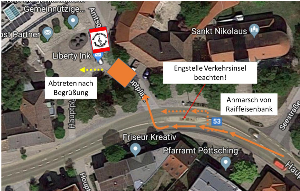
Abbildung 2 Anmarsch und Begrüßung